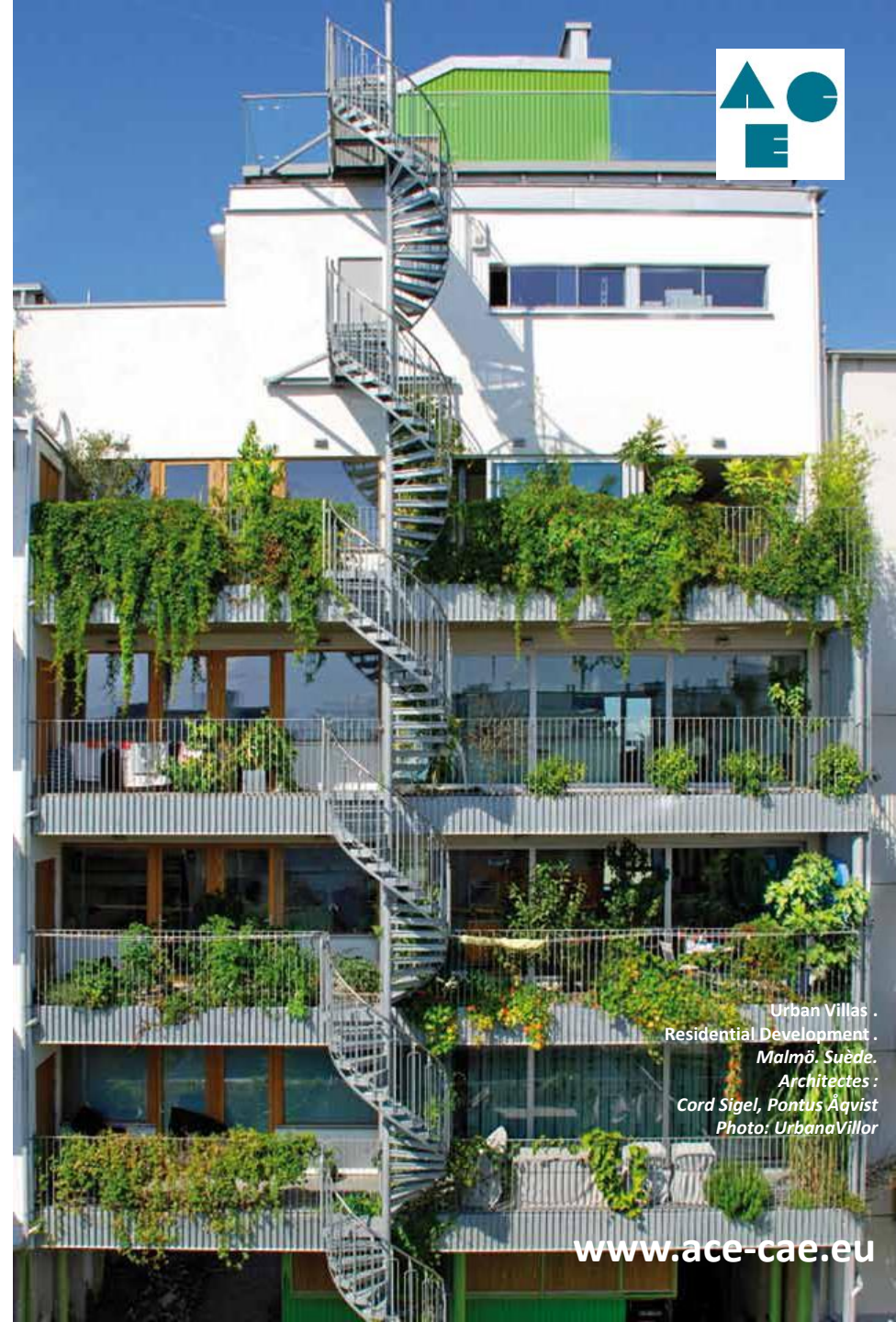
Urban Villas . Residential Development . Malmö, Suède. Architectes : Cord Sigel, Pontus Åqvist