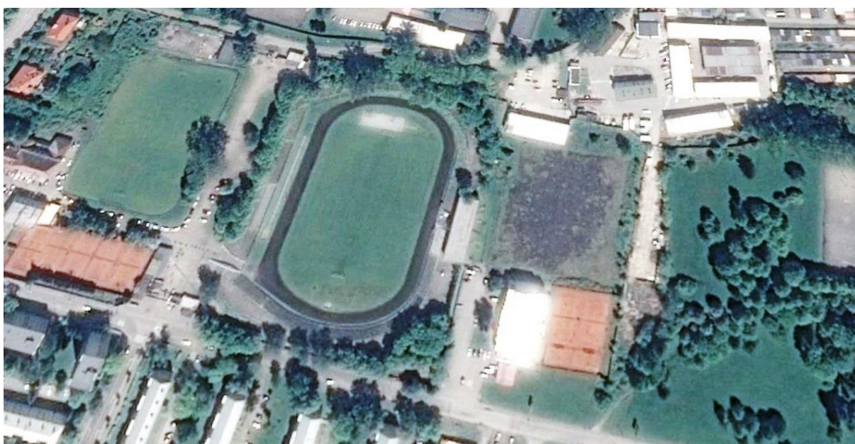
Ortofoto mapa riešeného územia

3.1 Cieľom je výber spracovateľa urbanistickej štúdie zóny riešeného územia a projektu areálu Aquacentra pre územné rozhodnutie a stavebné povolenie. Situovanie Martinského Aquacentra na riešené územie je v súlade s platným Územným plánom sídelného útvaru Martin (ÚPN-SÚ), Zmeny